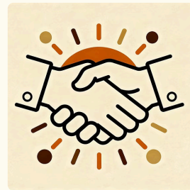
Promesse et offre alignée

Identifiez précisément votre client idéal, comprenez ses besoins profonds, ses freins et ses motivations. Adaptez votre message pour résonner authentiquement avec votre cible.