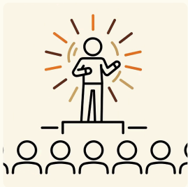
Message phare et posture

Les trois premiers modules constituent le socle de votre transformation communicationnelle. Ils vous permettent de clarifier qui vous êtes, à qui vous vous adressez, et ce que vous proposez. Ces fondations sont essentielles pour construire une communication authentique et efficace.